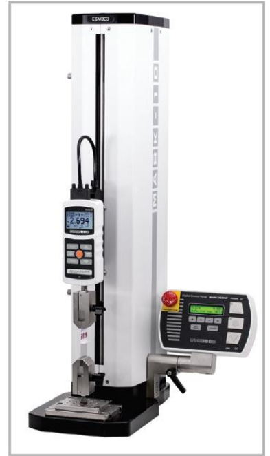
圖例：ESM303 測試台 和 G1061 楔形夾具